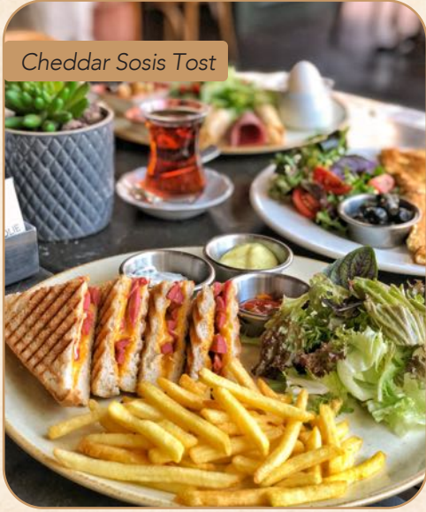
Cheddar Sosis Tost